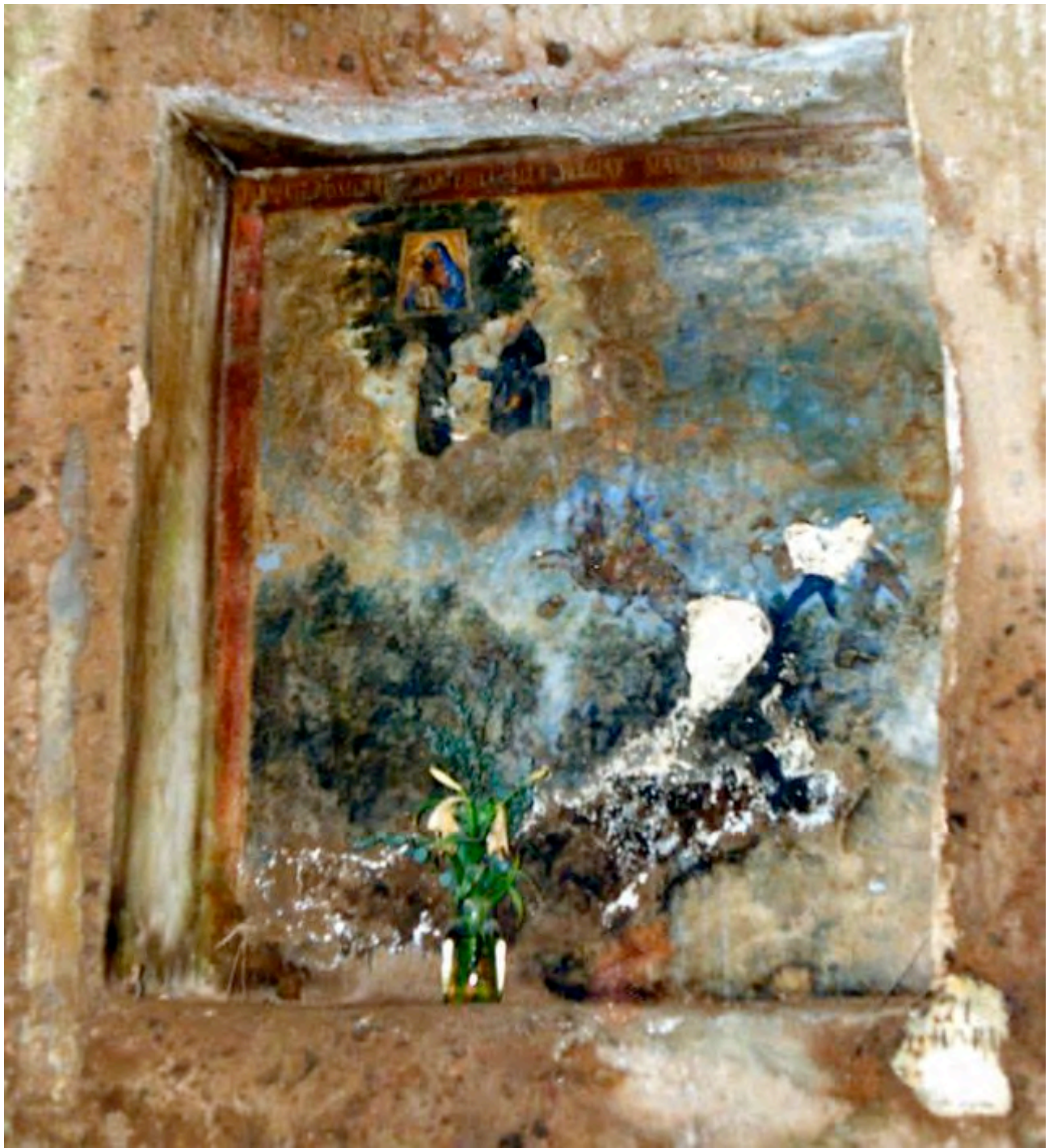
Foto dell'edicola prima del restauro 1992