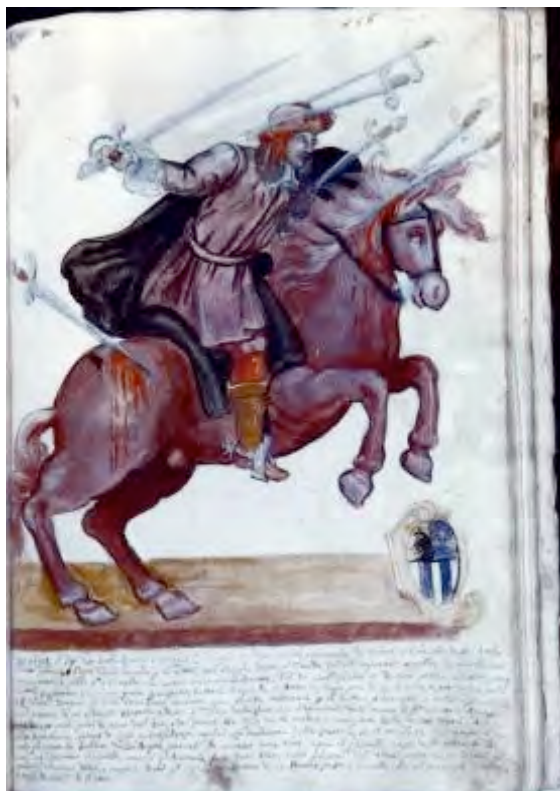
Acquerello di Vincenzo Panicale - 1619- Tratto dal "Libro dei Miracoli" p.156- Bibl. Besso Roma

"L'anno 1502[1506] il sig. Gio. Battista Spiriti viterbese colonnello di gran valore ritornando di Roma a cavallo dalla ambasciaria fatta papa Giulio secondo per la sua città, nel luogo detto il Guado fu all'improvviso assalito da molti suoi inimici tanto a piedi quanto a cavallo con armi anco avvelenate. Fu da quelli ferito in diverse parti e costretto pure a cavallo fuggirsene verso un gran precipitio detto la rupe di S. Antonio, larga più di 10 braccia, e profonda più di 60: vedutosi dunque il Nobil Cavaliere serrata ogni strada naturale. per la difesa, o scampo, si voltò a quella che è più potente di un ordinato esercito e disse: Santissima Vergine della Quercia liberate-' delle mani de questi inimici. A questa voce dissero quelli privi di senno dall'ira e dal furore. Né Cristo né la madre ti camperà dalle nostre mani. All'horrenda bastemmia ripieno di zelo e confidenza replicò: la Madonna della Quercia et il suo Figlio mi camperà et essen do già sopra le labbra della rupe, parveli di sentire una voce sopra il cavallo, passa dall'altra banda. Mirabil cosa. Spronato il cavallo come se questo animale fosse stato alato saltò felicemente dall'altra parte senza lesione alcuna restando gl'inimici delusi e confusi Portò questo signore la sua statua di un huomo ferito a cavallo, che al presente si vede e fu sempre devotissimo di questa casa".