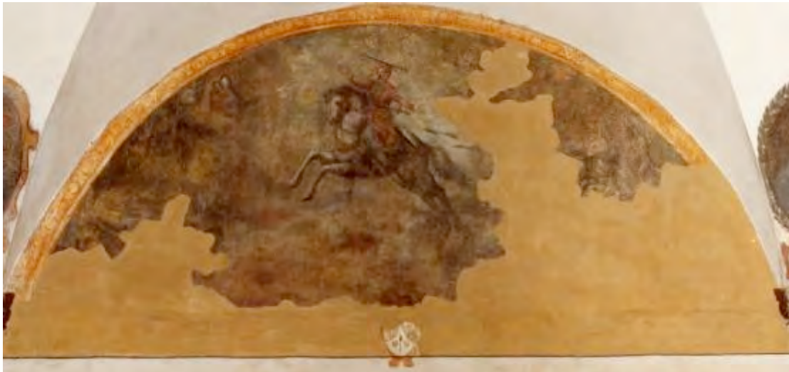
1506 Giovan Battista Spirti - Affresco chiostro della cisterna sec. XVII