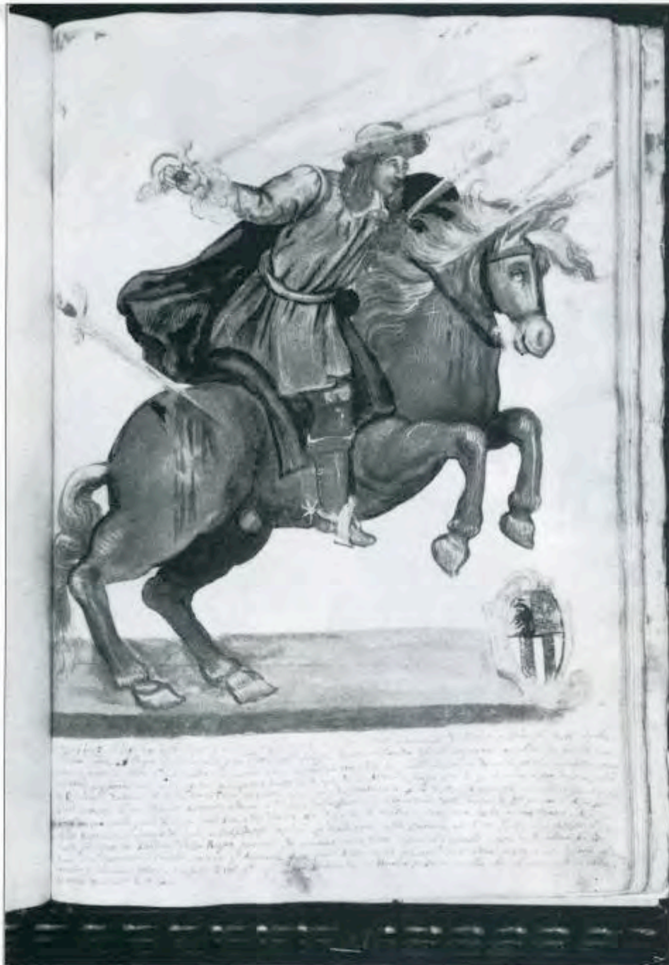
Acquarello tratto da un volume manoscritto del 1619, esistente presso la Biblioteca della Fondazione Beno di Roma.