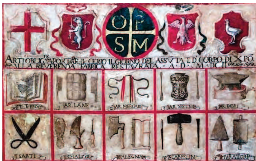
Parte superiore della tavola con i simboli delle arti di Orvieto: il n. 4 è quello dell'arte dei fabbri

Si chiede la cagione perché puzza lo sterco d'un cavallo, e se lo causa la flegma, ovvero l'orina: dico di no; che è il sangue, che fa puzzare lo sterco: perché esso è più caldo che non è la flegma, & l'orina: sì che per il calor suo quando lo sterco non è bene digesto puzza per lo gran calore, che dà il sangue dentro il corpo del cavallo, sì che per questo si deve cavar sangue spesso alli cavalli quando hanno simile infermità.