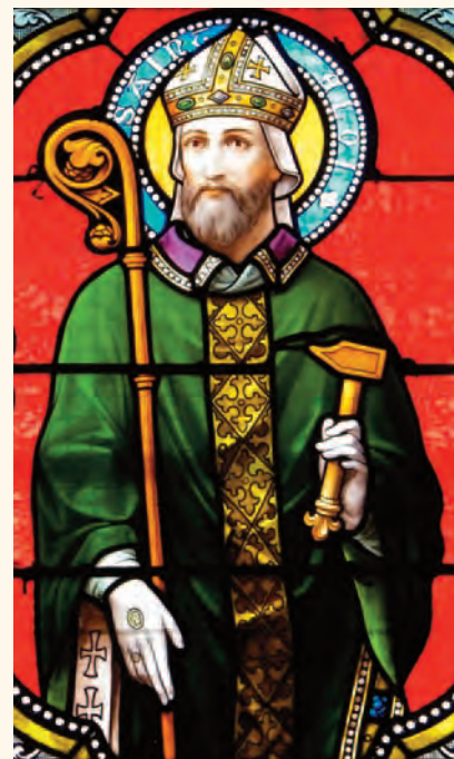
Sant'Eligio, il santo con il martello protettore dei fabbri

e partecipare al funerale; chi non fosse mancato avrebbe dovuto pagare un'ammenda di 10 soldi. Quando nel 1727 all'arte dei fabbri subentrò l'omonima confraternita, il regolamento riguardante l'associazione venne aggiornato e si scelsero come santi protettori sant'Eligio e santa Lucia.