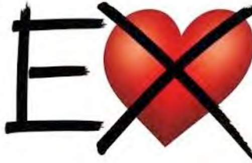
Logo del film 'EX'